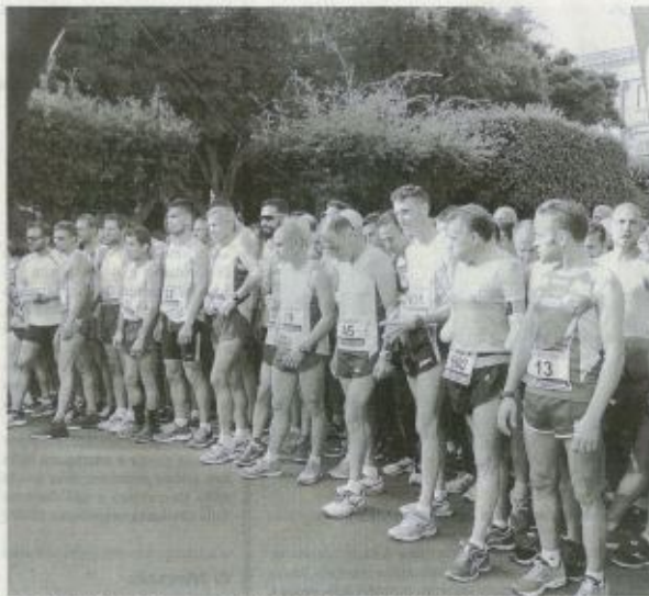
Una affollata linea di partenza di «Sale e Saline» e accanto un passaggio di atleti

Un successo di partecipazione che si sposa felicemente i risultati tecnici, anche se si è dovuta registrare l'assenza degli annunciati podisti africani. Ma ciò non ha pregiudicato la gara che alla fine ha vi-